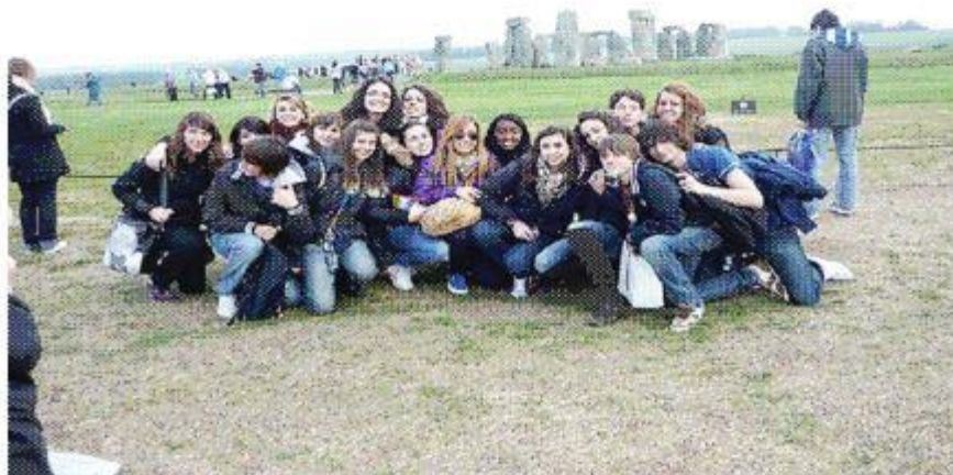
Soggiorno linguistico ad Oxford - classe V A - a.s. 2009-2010