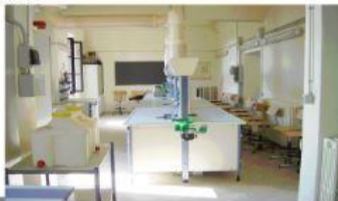
Laboratorio di Scienze